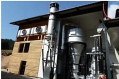
Elektrana na drvni plin